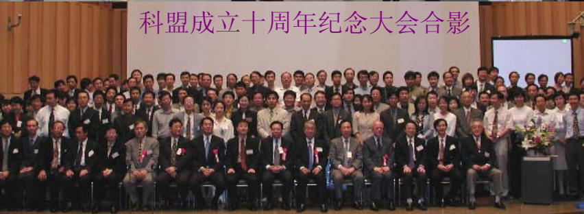
科盟成立十周年纪念大会合影