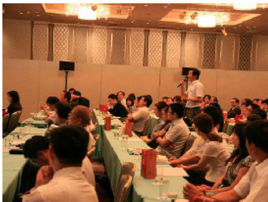
南京 521 人才计划推介会现场提问，气氛热烈