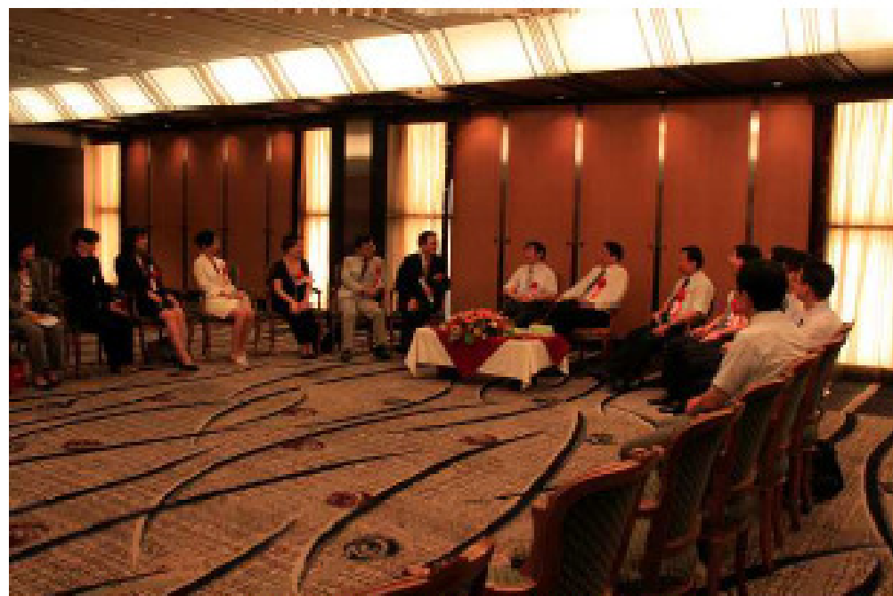
南京市杨卫泽书记会见科盟负责人及旅日各界精英