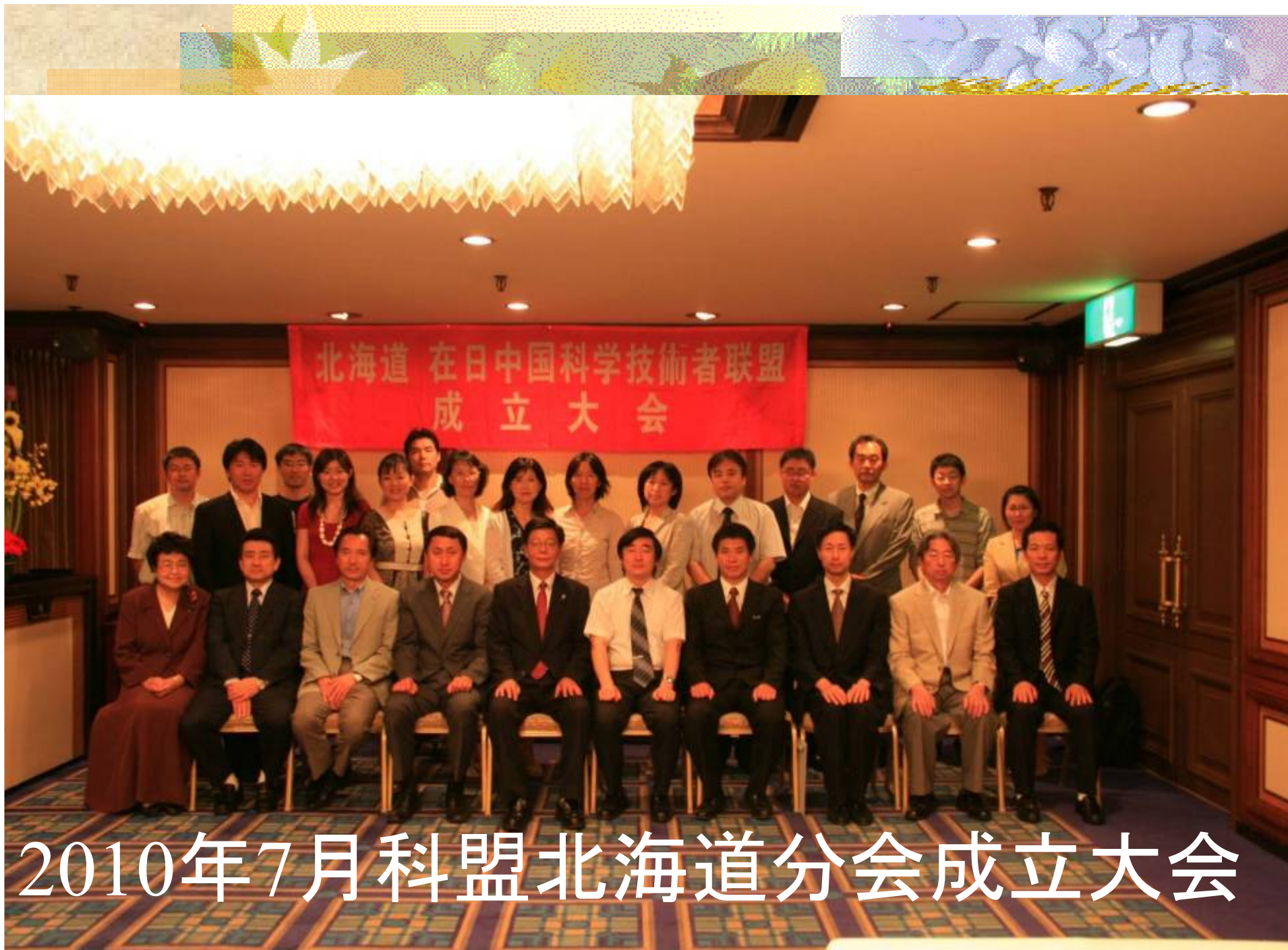
2010年7月科盟北海道分会成立大会