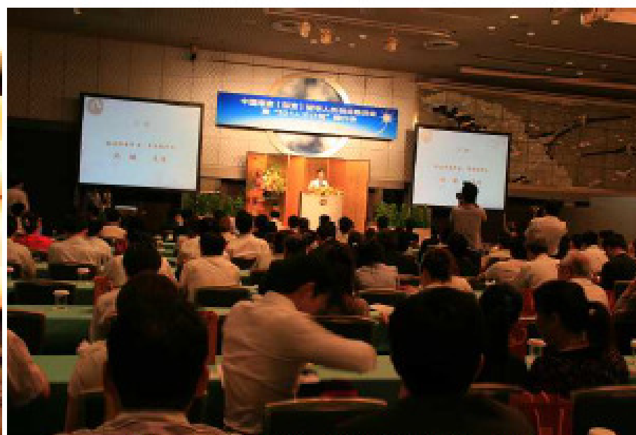
南京 321 人才计划推介会上，沈健常务副市长介绍 321 计划