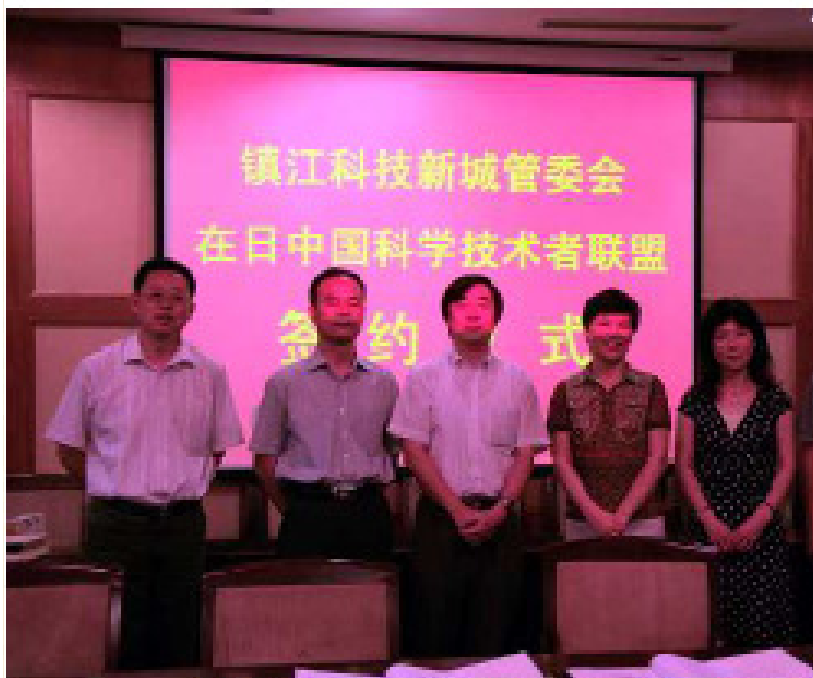
镇江科技新城管委会与在日中国科学技术者联盟签约仪式

代表团访问大连市工商联，就大连市油压机械民营企业去日本购买中小企业和技术设备等事宜达成协议。